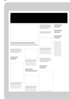
AD-Zone «Full Header» Positionierung im Slider des Headers