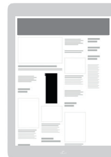
AD-Zone «Grid Top 10» Positionierung im oberen Drittel der Seite / Vorzugsplatzierung in der Smartphone-Ansicht

Sichtbarkeit: Startseite oder Rubrik nach Wahl