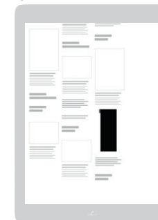
AD-Zone «Grid Top 25» Positionierung im unteren Drittel der Seite / Vorzugsplatzierung in der Smartphone-Ansicht

Sichtbarkeit: Startseite oder Rubrik nach Wahl