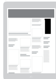
AD-Zone «Top-Right» Positionierung oben rechts

Sichtbarkeit: Startseite oder Rubrik nach Wahl