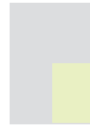
1|4 Seite **96 × 131 mm