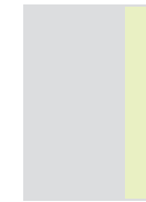
1|4 Seite hoch *55 × 300 mm **45 × 270 mm