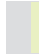
1|3 Seite hoch *72 × 300 mm **62 × 270 mm