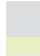
1|3 Seite quer *230 × 95 mm **197 × 85 mm