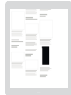
AD-Zone «Grid Top 25» Positionierung im unteren Drittel der Seite / Vorzugsplatzierung in der Smartphone-Ansicht

Sichtbarkeit: Startseite oder Rubrik nach Wahl