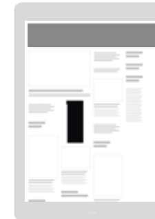
AD-Zone «Grid Top 10» Positionierung im oberen Drittel der Seite / Vorzugsplatzierung in der Smartphone-Ansicht

Sichtbarkeit: Startseite oder Rubrik nach Wahl