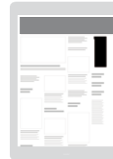
AD-Zone «Top-Right» Positionierung oben rechts

Sichtbarkeit: Startseite oder Rubrik nach Wahl