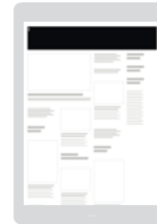
AD-Zone «Full Header» Positionierung im Slider des Headers