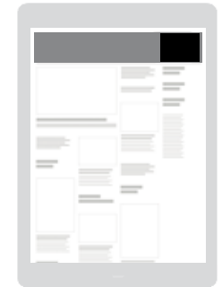
AD-Zone «Movie-Star» Positionierung ganz oben rechts