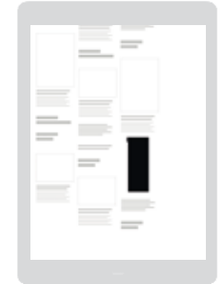
AD-Zone «Grid Top 25» Positionierung im unteren Drittel der Seite / Vorzugsplatzierung in der Smartphone-Ansicht

Sichtbarkeit: Startseite oder Rubrik nach Wahl