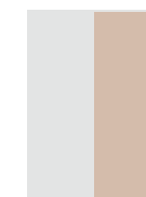
1|2 Seite hoch *106 × 300 mm **96 × 270 mm