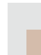
1|4 Seite **96 × 131 mm