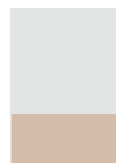
1|3 Seite quer *230 × 95 mm **197 × 85 mm