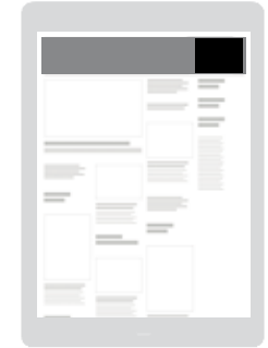
Zone AD «Movie-Star» Positionnement en haut à droite

Visibilité: Sur toutes les pages d'entrée